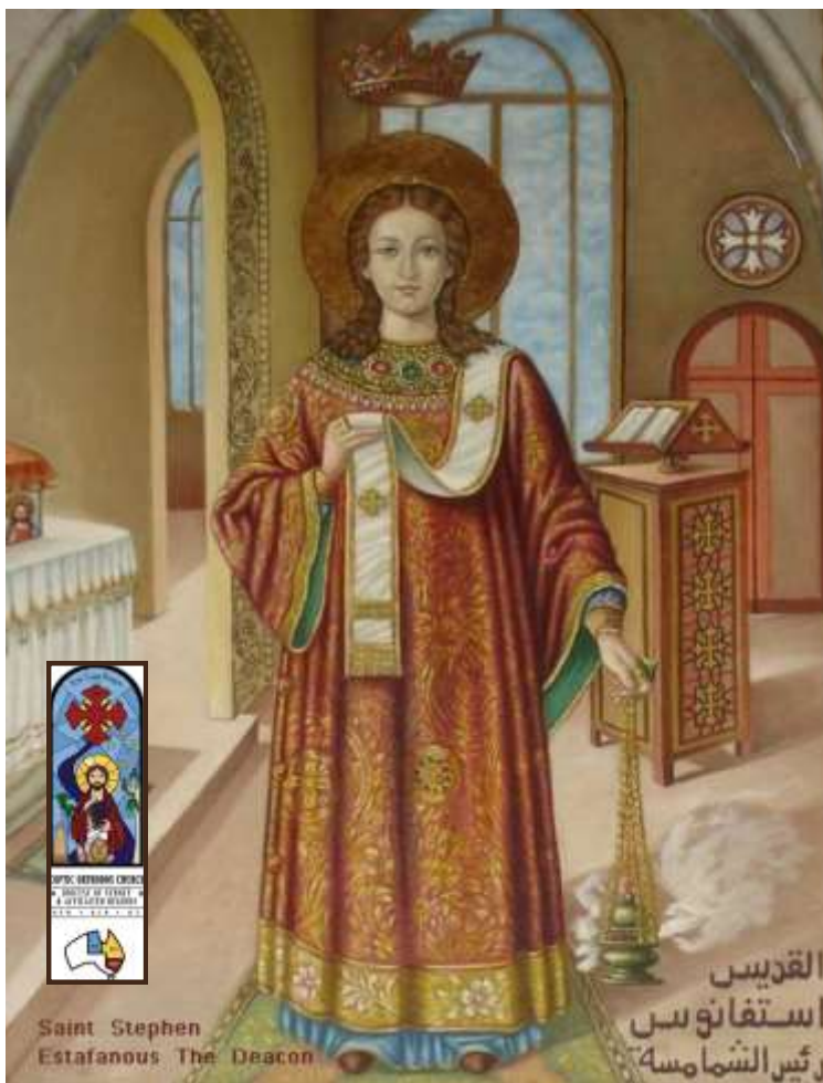
Saint Stephen Estafanos The Deacon

24 I said, "O my God, Do not take me away in the midst of my days; Your years are throughout all generations.